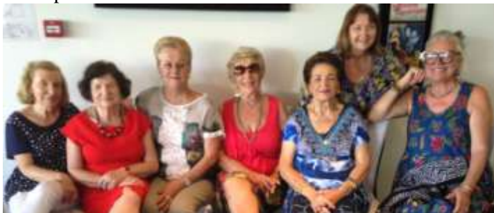
Ladies at International Women's Day Lunch

Venerdì 8 marzo, circa 20 signore si sono incontrate per festeggiare la Giornata Internazionale delle Donne con un pranzo al Gold Coast Italo Australian Club. È stata una buona occasione per passare del tempo insieme a chiacchierare. Nella foto qui sotto ci sono alcune delle signore presenti. Ricordiamo che il terzo mercoledì del mese c'è il pranzo per "Gli Amici della Dante" al Gold Coast Italo Australian Club. Il prossimo sarà il 17 aprile. Tutti sono benvenuti.