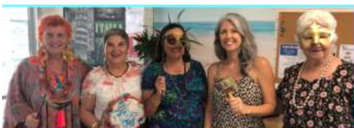
The Coro entertained the Co.As.It. Clients

The Choir "Il Coro" meets every Tuesday night during the school term at 5.45 p.m. All welcome.