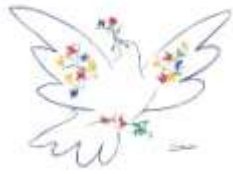
Picasso's symbol of Peace.